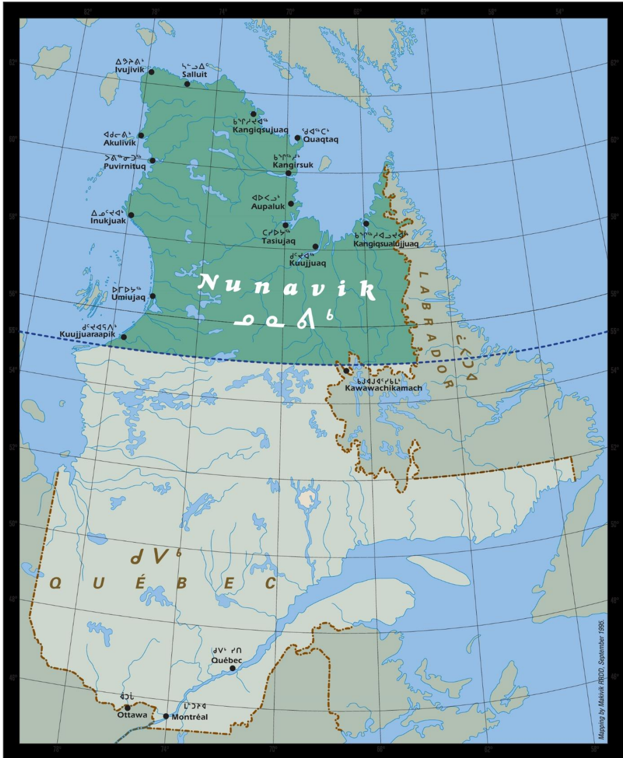
FIGURE 1: CARTE DU NUNAVIK