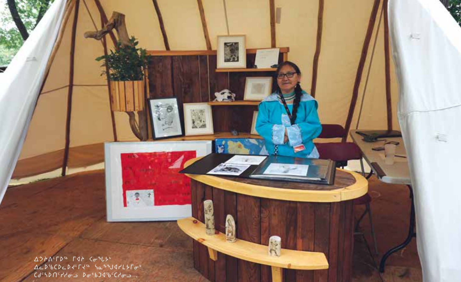
ልጅ ለገደግ ገላት ርጅጅ ልጅ ለገደግ ገላት ገላት ለገደግ ገላት ርጅጅ ለገደግ ገላት ለገደግ ገላት .